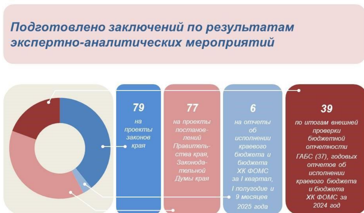
Рисунок 5. Структура заключений по результатам проведенной экспертизы

За 2025 год Контрольно-счетной палатой края в рамках осуществления полномочий по государственному внешнему финансовому контролю проведено 203 экспертно-аналитических мероприятия, по результатам которых составлено 2 отчета по тематическим мероприятиям, 201 заключение – по результатам проведения экспертиз проектов краевых законов и иных нормативных правовых актов органов государственной власти края и анализа исполнения и контроля за организацией исполнения краевого бюджета и бюджета ХК ФОМС.