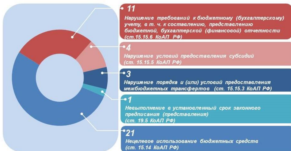
Рисунок 4. Сведения об инициировании административного производства

По субъектному составу административные производства возбуждены в отношении 32 должностных лиц, из которых в отношении лиц, замещающих государственные должности края, – 5, в отношении лиц, замещающих муниципальные должности, – 4, в отношении муниципальных служащих муниципальных образований края – 12, в отношении должностных лиц краевых и муниципальных бюджетных учреждений – 11.