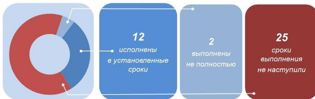
Рисунок 3. Сведения об исполнении представлений, внесенных в 2025 году

Неисполненные представления находятся на контроле аудиторов и заместителя председателя КСП.