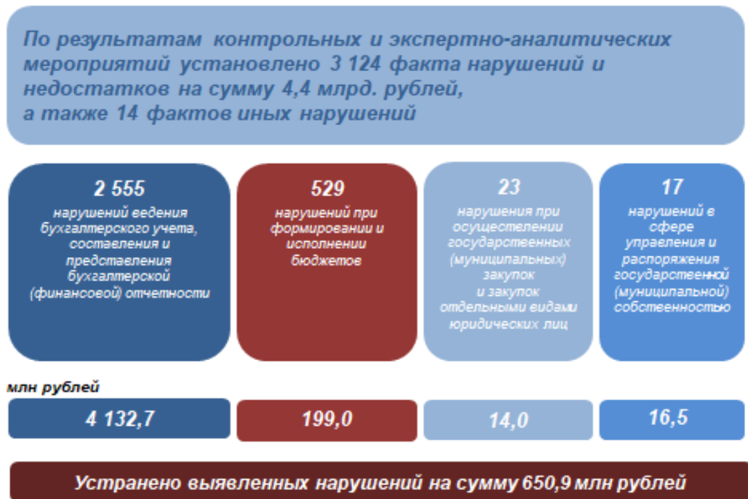
Рисунок 2. Структура выявленных при осуществлении внешнего финансового контроля нарушений в 2025 году (млн рублей)

Наибольшая доля выявленных нарушений приходится на нарушения, допускаемые при ведении бухгалтерского учета, составлении и представлении бухгалтерской (финансовой) отчетности - 94,7 %.